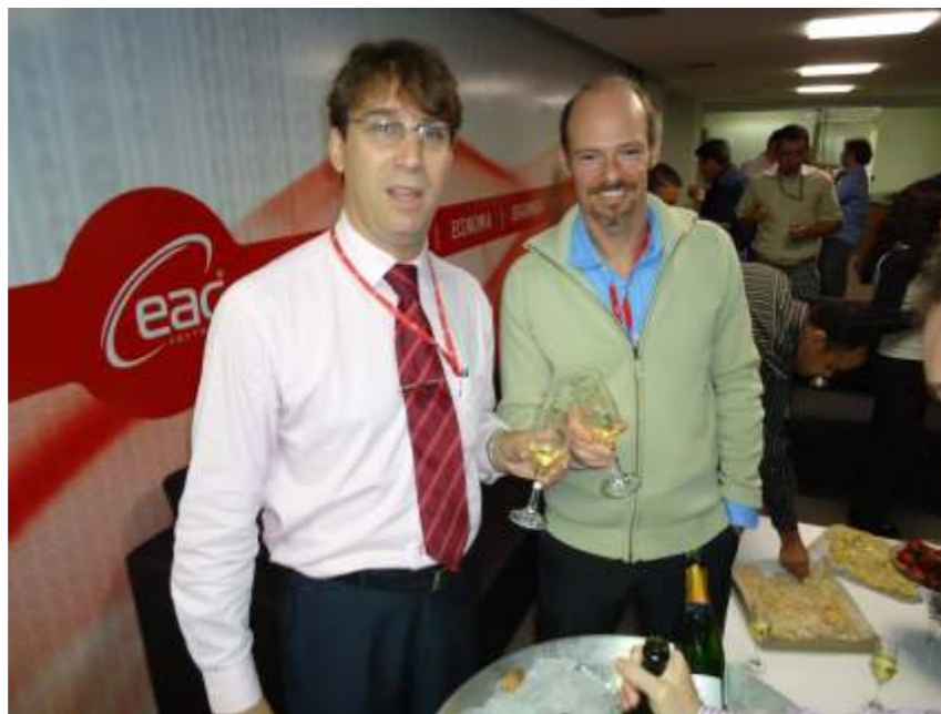
O brinde realizado com todos os funcionários da EAC Software durante a inauguração interna